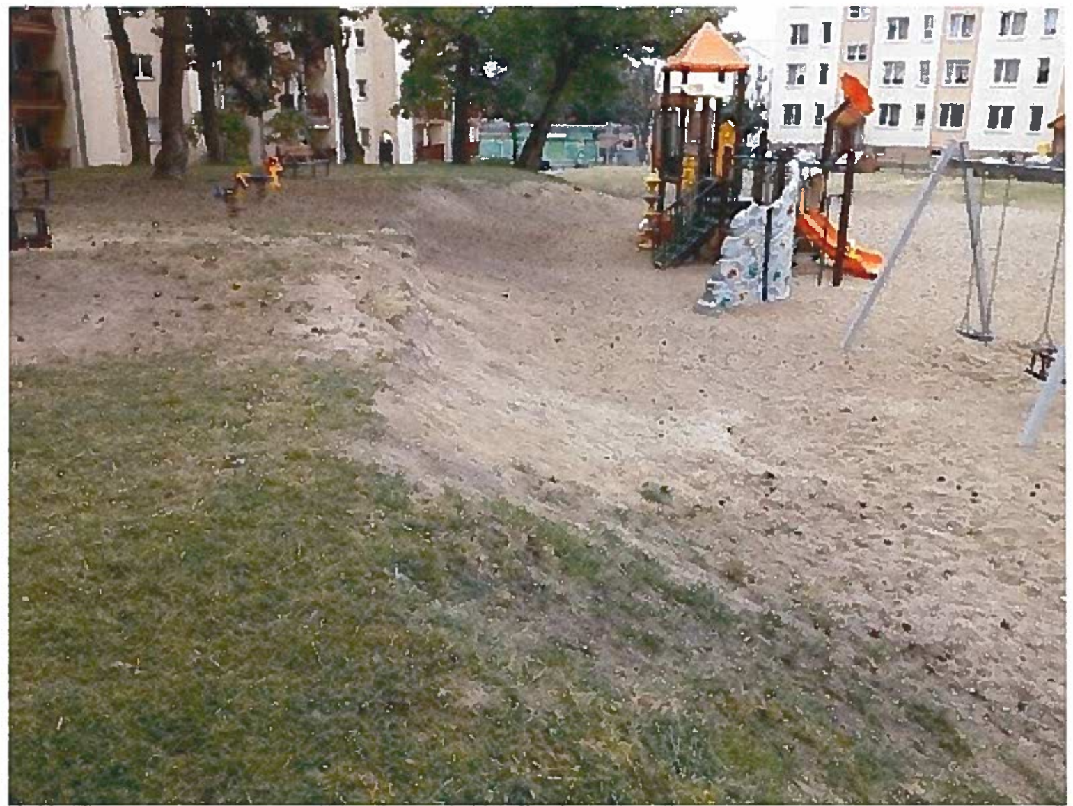
zdjęcie nr 2